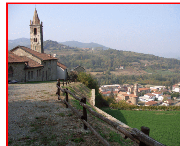
La chiesa vecchia e il sottostante paese di Ponti

Stazione ferroviaria di Acqui Terme Autolinee Arfea Tel. 0131-445433 E-mail: arfea@interbusiness.it